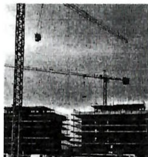
Edilizia. Dal 2008 sono scomparsi 600 mila posti di lavoro nel settore

Segnali di ripresa arrivano invece dal mercato immobiliare. Il sondaggio congiunturale della Banca d'Italia su 1.534 agenzie immobiliari mostra prezzi all'insegna della stabilità e una domanda in miglioramento. La quota di agenti che indicano pressioni al ribasso sulle quotazioni scende al 25,4% nel primo trimestre dal 28% del trimestre precedente, mentre aumentano i giudizi di stabilità dei prezzi, che salgono al 71% dal 67,8%. Per il futuro gli operatori manifestano prospettive che «rimangono favorevoli, seppure in misura lievemente inferiore rispetto al trimestre precedente». ◀