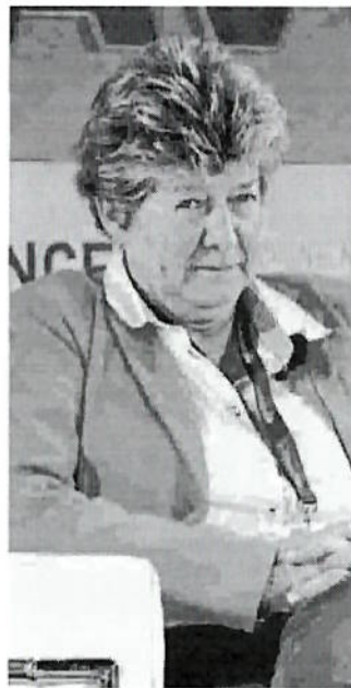
Cgil Susanna Camusso

Anche il presidente del parlamento europeo, il forzista Antonio Tajani, boccia la misura di sostegno ai senza lavoro: «Il problema del Sud non si risolve con 700 euro di reddito di cittadinanza, dobbiamo creare lavoro, dare ai giovani una prospettiva, non dare loro un contentino per non farli lavorare e fargli avere qualche soldo in tasca». Nel dettaglio