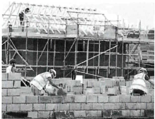
Frenata della produzione edilizia a inizio 2018

Segnali di ripresa arrivano invece dal mercato immobiliare. Il sondaggio della Banca d'Italia su 1.534 agenzie immobiliari mostra prezzi stabili e una domanda in miglioramento. La quota di agenti che indicano pressioni al ribasso sulle quotazioni scende al 25,4% nel primo trimestre dal 28% del trimestre precedente, mentre aumentano i giudizi di stabilità dei prezzi, che salgono al 71% dal 67,8%. E le prospettive che «rimangono favorevoli, su un orizzonte sia di breve sia di medio termine, seppure in misura lievemente inferiore rispetto al trimestre precedente». •