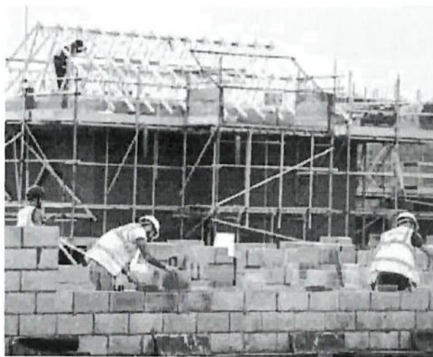
Frenata della produzione edilizia a inizio 2018

Segnali di ripresa arrivano invece dal mercato immobiliare. Il sondaggio della Banca d'Italia su 1.534 agenzie immobiliari mostra prezzi stabili e una domanda in miglioramento. La quota di agenti che indicano pressioni al ribasso sulle quotazioni scende al 25,4% nel primo trimestre dal 28% del trimestre precedente, mentre aumentano i giudizi di stabilità dei prezzi, che salgono al 71% dal 67,8%. E le prospettive che «rimangono favorevoli, su un orizzonte sia di breve sia di medio termine, seppure in misura lievemente inferiore rispetto al trimestre precedente». •