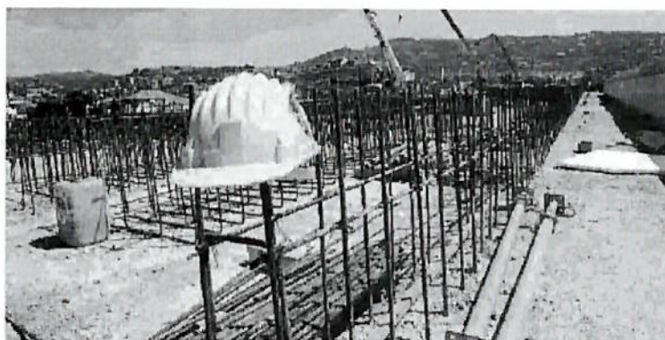
Edilizia, a maggio altro calo nella produzione

Segnali di ripresa arrivano invece dal mercato immobiliare. Il sondaggio congiunturale della Banca d'Italia su 1.534 agenzie immobiliari mostra prezzi all'insegna della stabilità e una domanda in miglioramento. La quota di agenti che indicano pressioni al ribasso sulle quotazioni scende al 25,4% nel primo trimestre dal 28% del trimestre precedente, mentre aumentano i giudizi di stabilità dei prezzi, che salgono al 71% dal 67,8%. Per il futuro gli operatori manifestano prospettive che «rimangono favorevoli, su un orizzonte sia di breve sia di medio termine, seppure in misura lievemente inferiore rispetto al trimestre precedente».