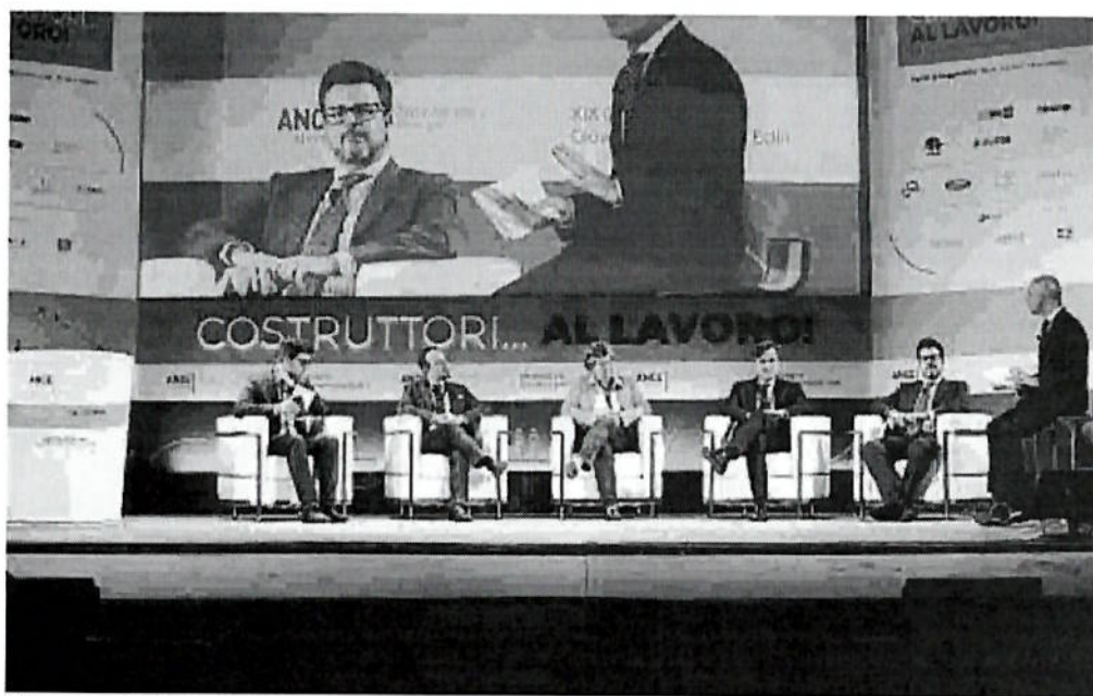
L'impresa Un momento dell'incontro dei giovani imprenditori dell'Ance ieri a Napoli

Nugnes Sulle quattro righe programmatiche ora proposte: inutile parlare sul vuoto