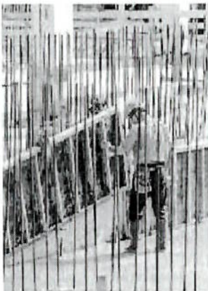
Un operaio in un cantiere

La quota di agenti che indicano pressioni al ribasso sulle quotazioni scende al 25,4% nel primo trimestre dal 28% del trimestre precedente, mentre aumentano i giudizi di stabilità dei prezzi, che salgono al 71% dal 67,8%. Per il futuro gli operatori manifestano prospettive che «rimangono favorevoli, su un orizzonte sia di breve sia di medio termine, seppure in misura lievemente inferiore rispetto al trimestre precedente». —