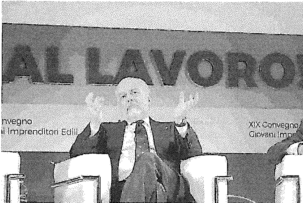
Aurelio De Laurentiis durante il convegno a Palazzo Reale